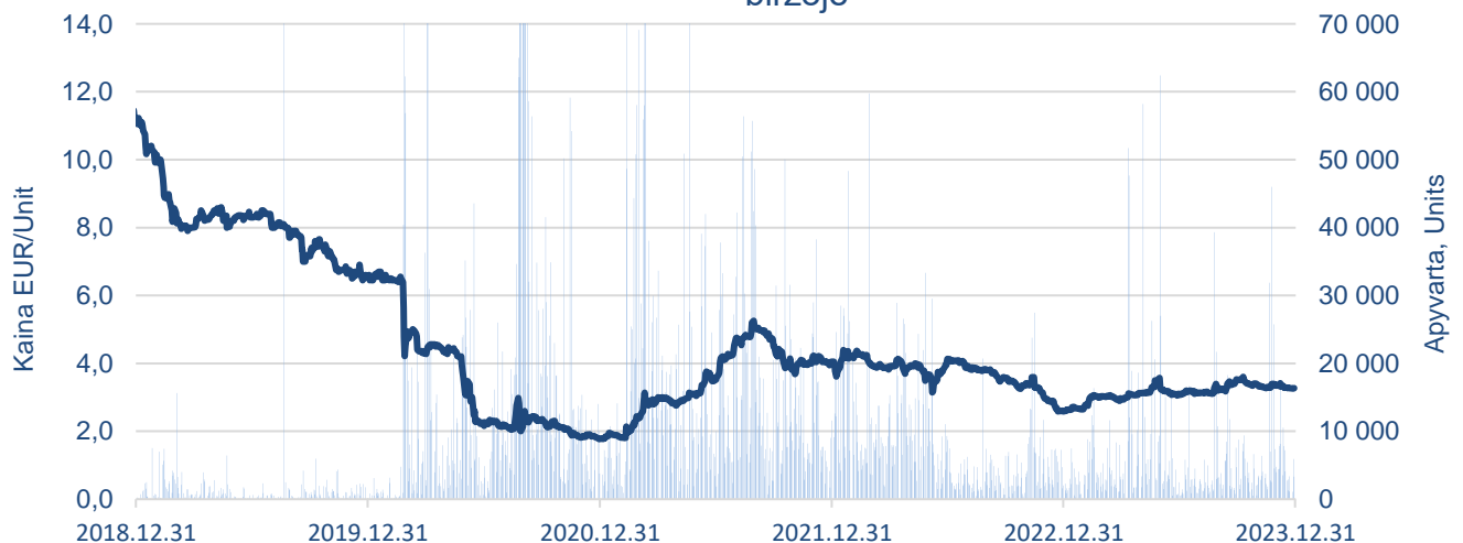
AB Novaturas akcijų kaina ir apyvarta Nasdaq Vilnius vertybinių popierių biržoje

2023 m. gruodžio 31 d. Bendrovės rinkos kapitalizacija buvo 26,8 mln. Eurų – per ketvirtą metų ketvirtį paaugo 5 proc.